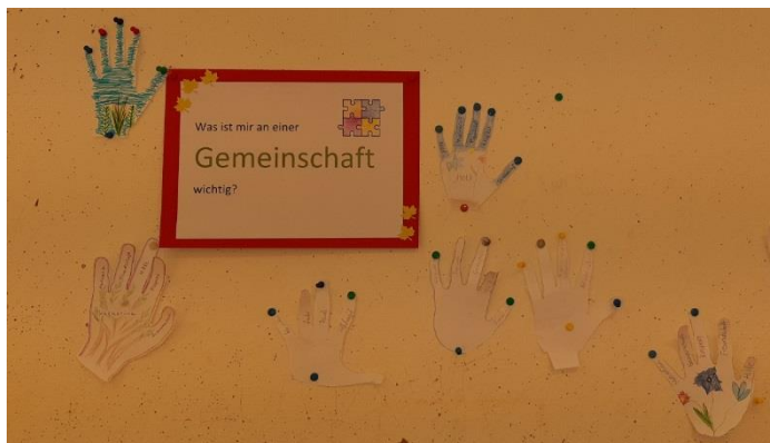
Der Gruppenraum der 1. Klassen

Was ist mir an einer Gemeinschaft wichtig?